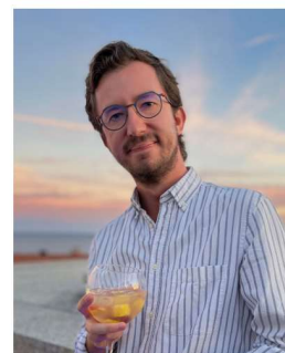
Louis VP comm'