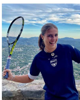
Charlotte VP sport