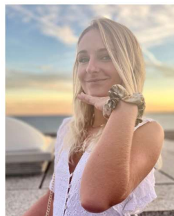
Oceane VP choix des stages médecine générale VP droit des internes