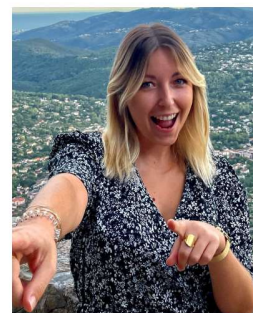
Sophie VP choix des stages médecine générale