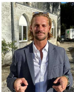
Thomas VP SOS VP droit des internes