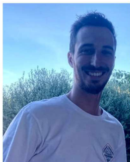
Franck VP event