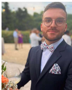
Romain VP choix des stages spécialités médicales