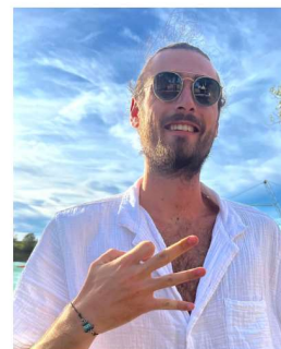
Gaetan VP event