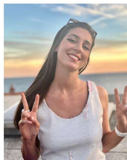
Lucille VP comm'