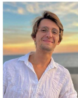
Yann VP part